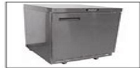
4400 Series Work-top and undercounter refrigerator bases