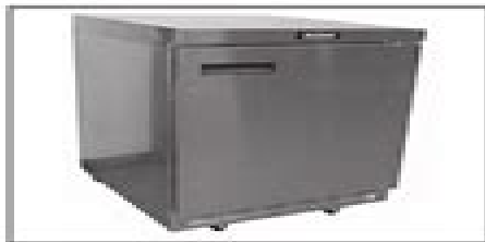
4500 Series Work-top and undercounter freezer bases