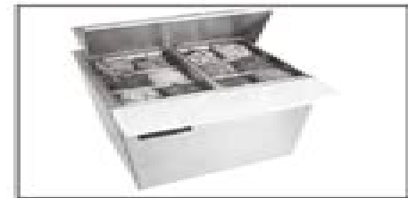
4400N-M Series Mega top refrigerated front breathers