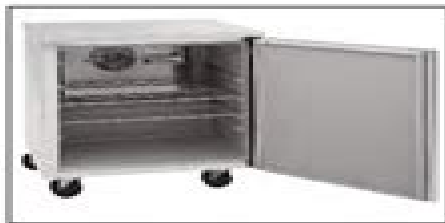
400 Series Work-top and undercounter refrigerator or freezer bases

Please read this manual completely before attempting to install or operate this equipment! Notify carrier of damage! Inspect all components immediately. See page 2.