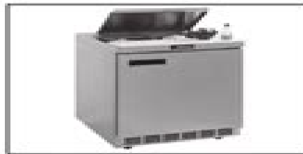
4400N Series Salad top refrigerator bases